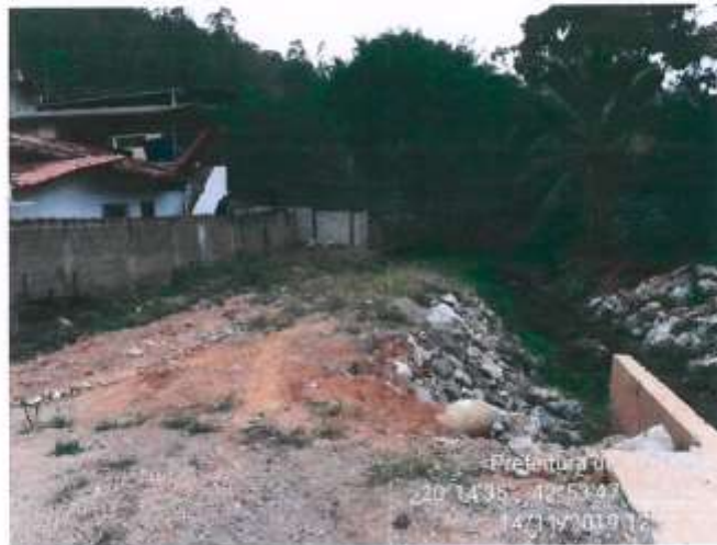
Figura 1- Vista geral do lote tomada da Rua Capitão João Martins