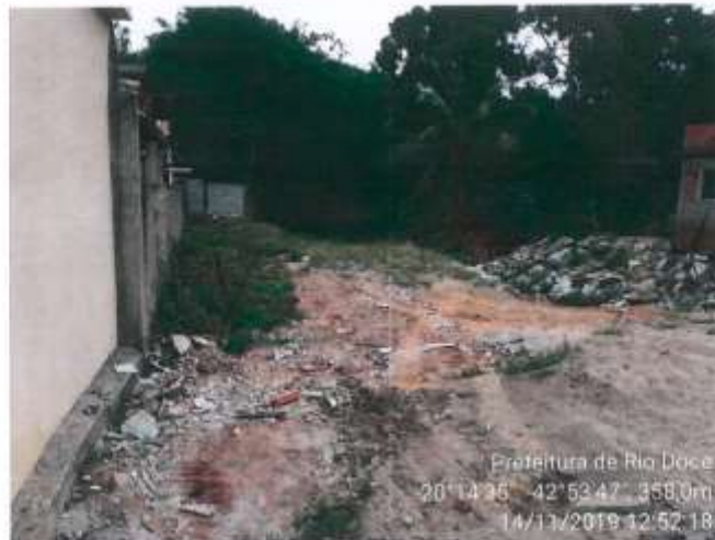
Figura 2 - Vista geral do lote tomada de outro ângulo da Rua Capitão João Martins